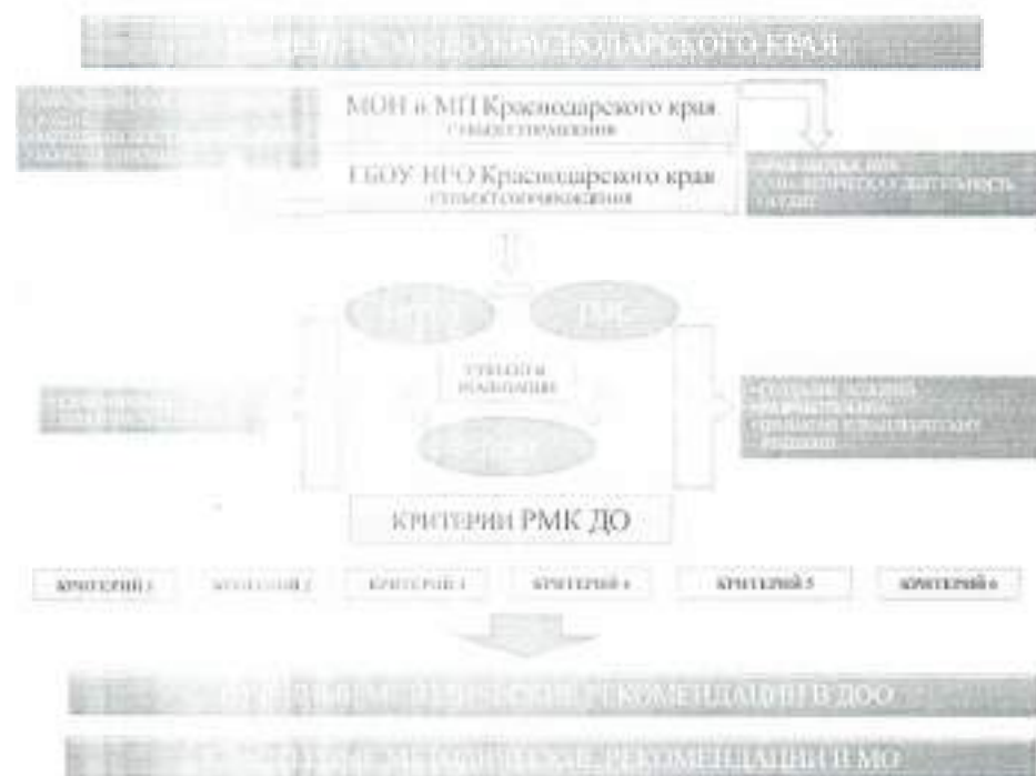
Рисунок 1 – Модель РСМК ДО

Субъекты реализации образовательных услуг вправе осуществлять оценку качества дошкольного образования - ВСОКО, в соответствии с локальными актами ДОУ.